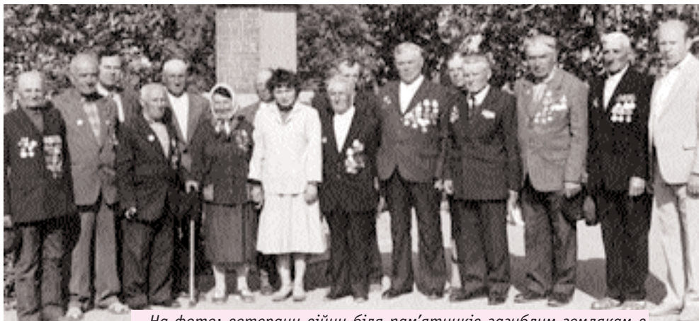
На фото: ветераны війни біля пам'ятоків загиблим землякам в Іванівці та на місці форсування Південного Бугу в Семенівці.

ветераны войны, участники боевых действий, 2005 год.